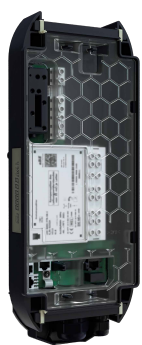
Wandmontage mit eCLICK